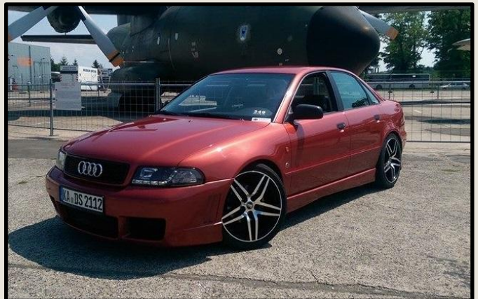
Audi A4 B5 alias Red B-Five